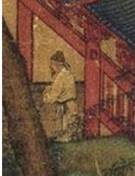
图二十七(e) 《江帆楼阁图》局部 人物