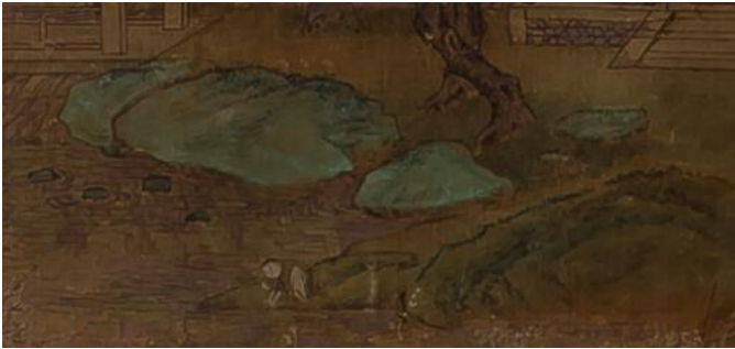
(f) 《春山待客图》局部 山石