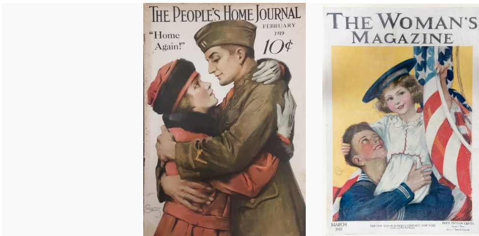
图四(a) 雅各布斯作杂志封面美军奔赴第一次世界大战前线宣传画“你一定要回来!”(《人民之家》1919年2月)