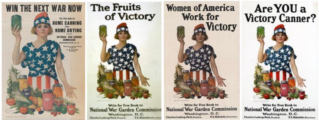
图三 雅各布斯设计第一次世界大战海报(1918年)