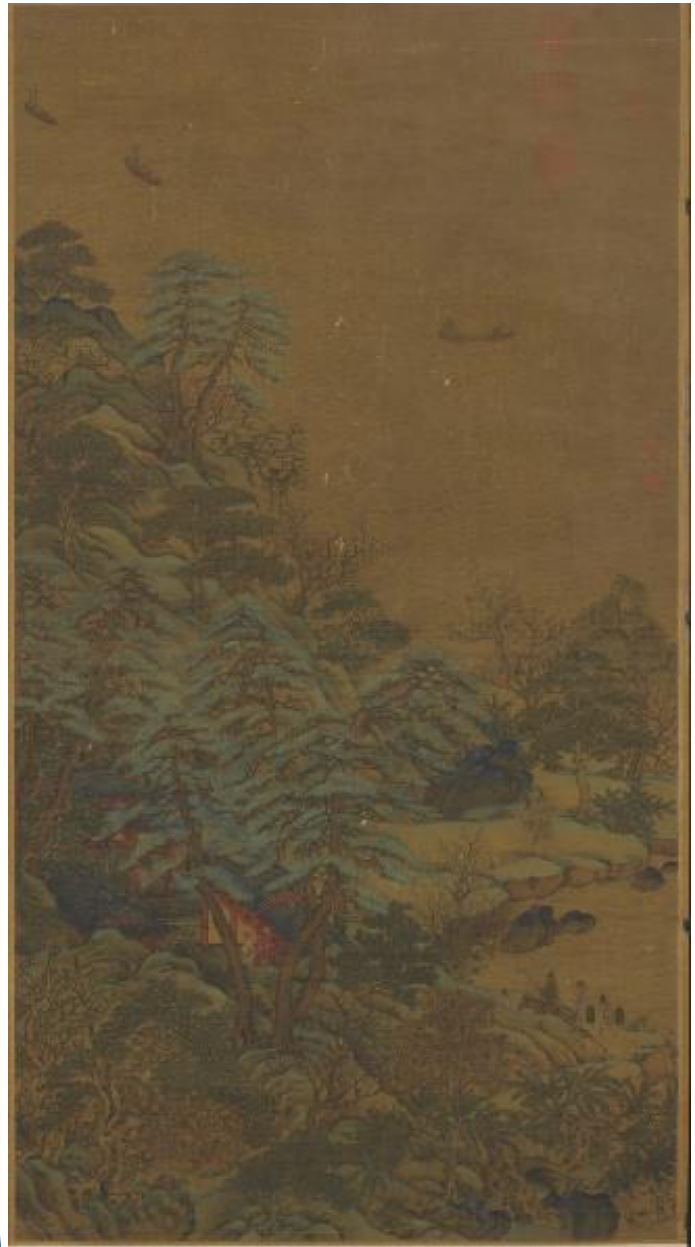
图二十七(a) (上左)北宋赵令穰《春山待客图》美国著名肖像画家 Leonebel Jacobs 旧藏 (b) (上右)传为李思训的《江帆楼阁图》台北故宫博物院藏