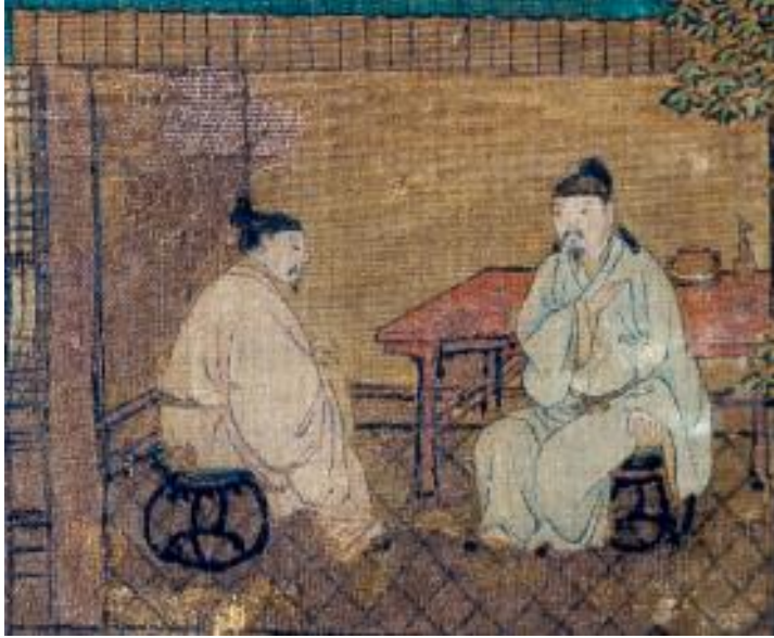
图二十七(d) 《春山待客图》局部 人物