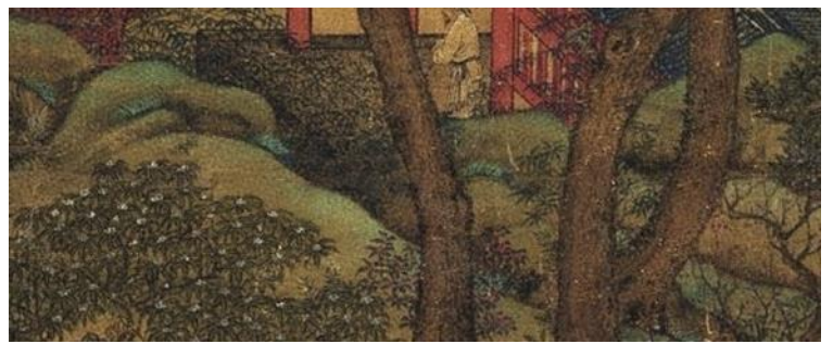
(g) 《江帆楼阁图》局部 山石